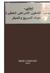
以色列 加热装置包装