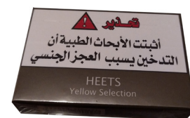
以色列 加热型香烟